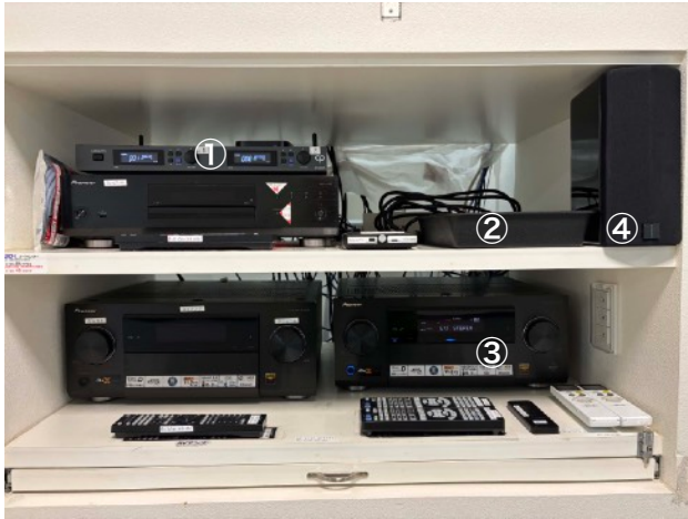
①ワイヤレスマイクの受信機